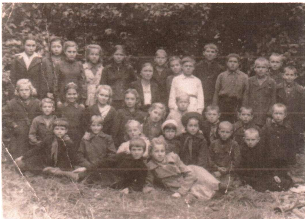
Фото 2. 1947 год. 4 класс.

20 февраля 1947 года выпущен приказ областного Управления по гражданским делам № 726/69 «Об осуществлении закона о всеобщем обязательном обучении детей». По этому приказу школу должны были посещать все дети школьного возраста.