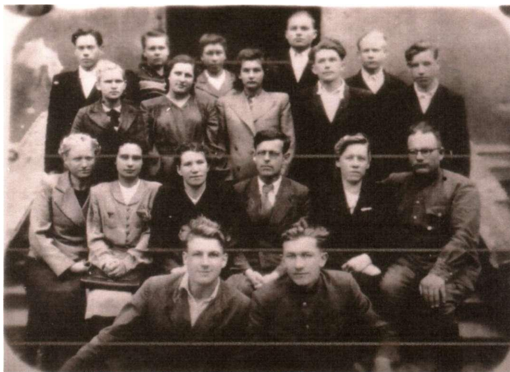
Фото 3. Ученики Нестеровской школы.

К 1955 году положение в школе особо не изменилось, хотя количество учащихся увеличилось до 243 человек. Состояние школы оставляло желать лучшего. Отопление в школе было не исправно и поэтому зимой из-за холодов дети занимались в верхней одежде. Сам учебный процесс шел удовлетворительно, дети занимались прилежно. Теперь дела с учебным материалом обстояли намного лучше.