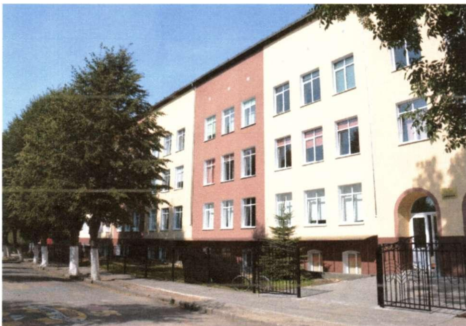
Фото 9. Школа после ремонта.