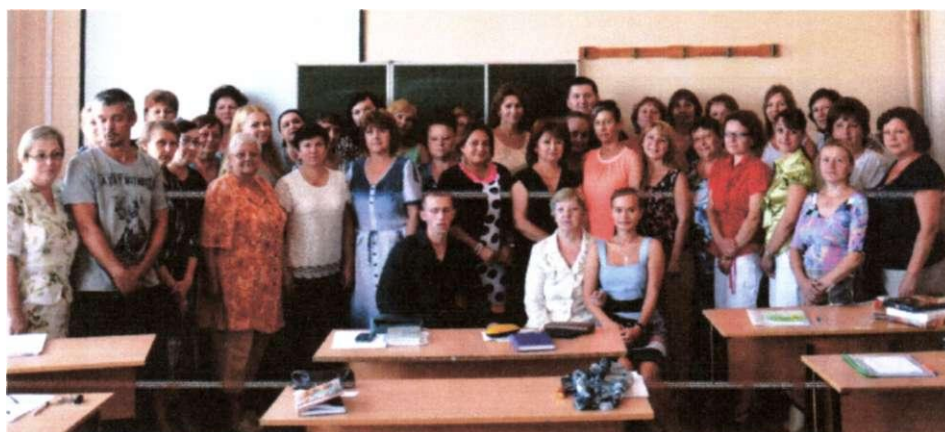
Фото 10. Педагогический коллектив школы 2015.

Духовно-нравственное развитие и воспитание учащихся школы в настоящее время является одним из важнейших приоритетов национальной безопасности России и ведется на протяжении нескольких лет через решение основных задач: введение отдельных курсов духовно-нравственной направленности ("Основы православной культуры" - 4 классы, "Истоки" - 1 - 3 классы); проведение обучающих и внеклассных мероприятий с учащимися, в т.ч. и с целью привлечения внимания родителей к вопросам ДНВ; повышение квалификации педагогов через курсы, семинары, мастер-классы.