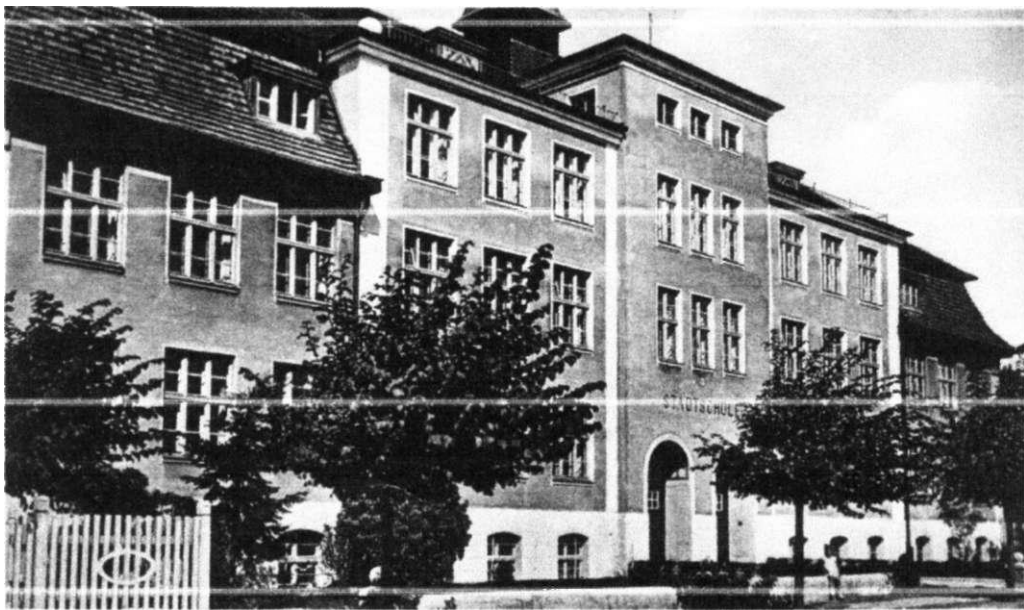
Фото 1. Нестеровская школа до Второй мировой войны.